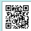
KENPOS スマホ用 QRコード